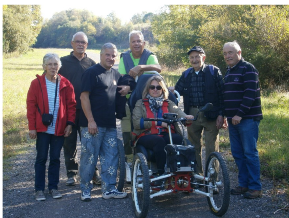
Randonnée découverte du patrimoine historique et naturel du bassin houiller avec les Randonneurs du Montet de Cransac en octobre 2016

Un autre club de la ligue fonctionne sur l'Aubrac à Laguiole et des projets sont à l'étude dans le bassin Decazevillois.