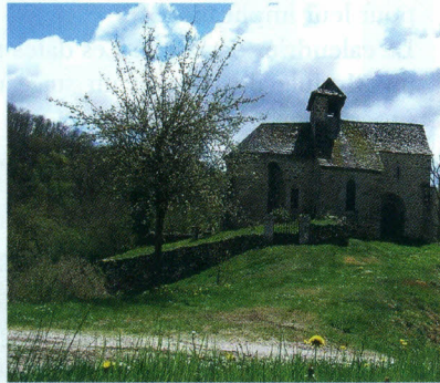
Chapelle de Manahval